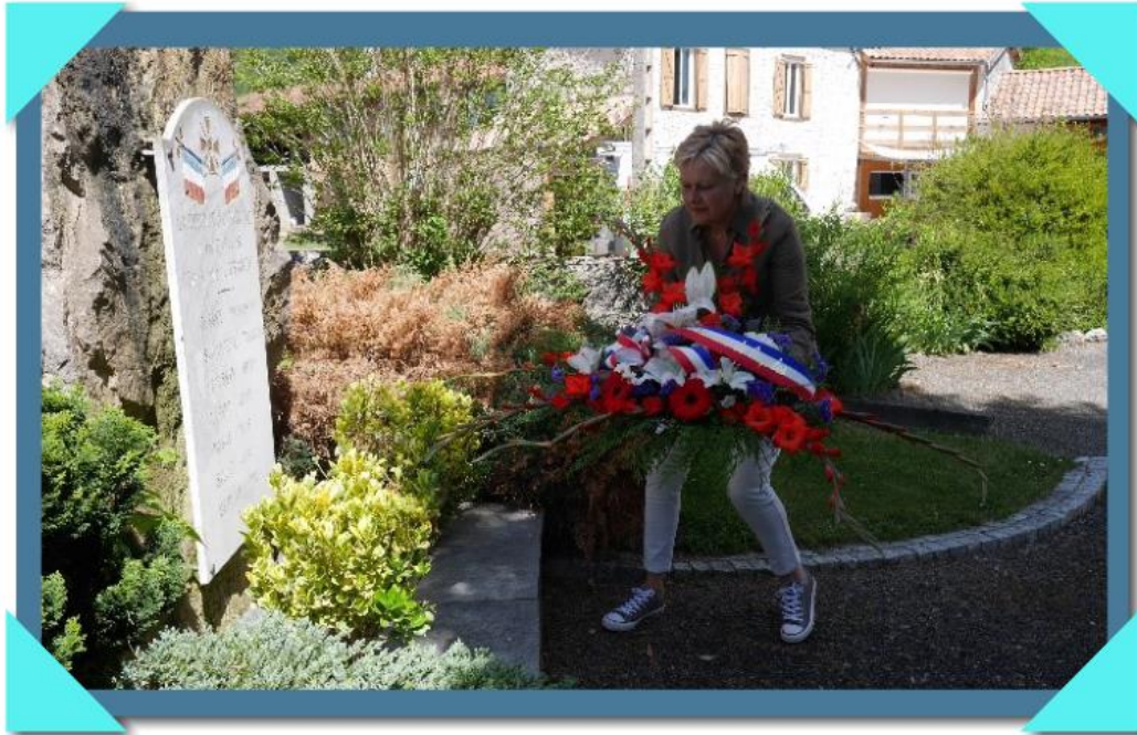
Dépôts de gerbe au monument aux morts